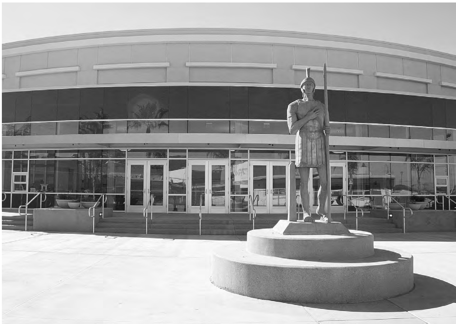
Chula Vista High is now home to the biggest and best-equipped theater in the South Bay. Pictured here is the new Creative and Performing Arts Center.

better environment for student learning, all construction is following environmentally-friendly building designs and practices. All landscaping will be water efficient relying on drought-resistant and native plants.