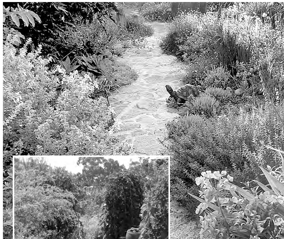
Gardens such as these are being certified by the City of Chula Vista.

There is no cost for this designation; interested residents and schools within the City of Chula Vista should contact the NatureScape program by phone at (619) 409-3893 or via email at conservation@ci.chula-vista.ca.us