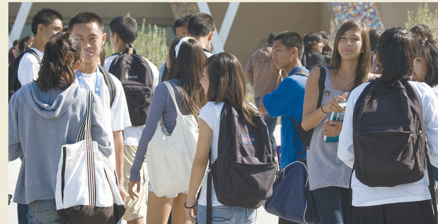
Olympian High School recibió su segundo premio de Campana Dorada en diciembre, este en reconocimiento de La Experiencia Compartida para Alumnos de Duodécimo Año. Estudiantes participando en La Experiencia Compartida usan proyectos de arte para ilustrar los temas de derechos humanos.

Cada año los maestros incorporan los temas del libro en sus proyectos académicos. Por ejemplo, en las clases de Gobierno, los alumnos estudian la política exterior de estados unidos y los esfuerzos del país en forjar seguridad económica y paz global. También escriben cartas a políticos, incluyendo al Presidente Obama, para expresar sus inquietudes y proponer pasos para mejorar el mundo.