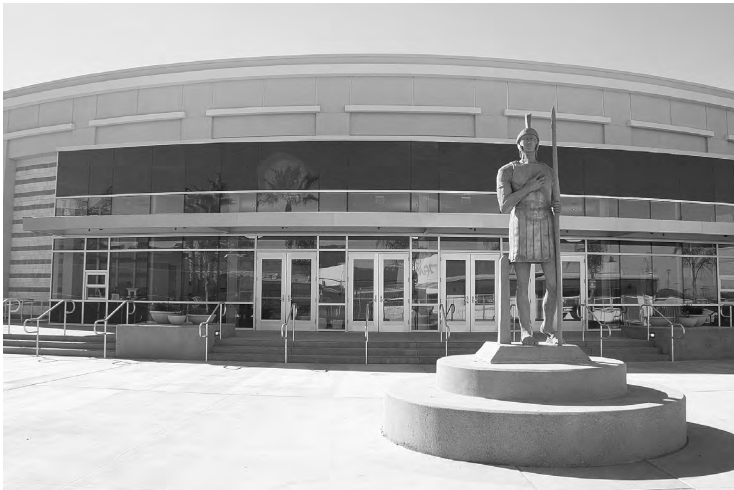
Chula Vista High ahora tiene el más grande y mejor equipado teatro en el sur del condado de San Diego. La foto es del nuevo Centro de Bellas Artes.

El edificio forma parte de la renovación de $20 millones para el campus provisto con fondos aprobados por la ciudadanía en la Propuesta O. Otros mejoramientos incluyen la remodelación del gimnasio, modernización de los salones de educación física adaptada y casilleros y una nueva biblioteca equipada con estaciones de com-