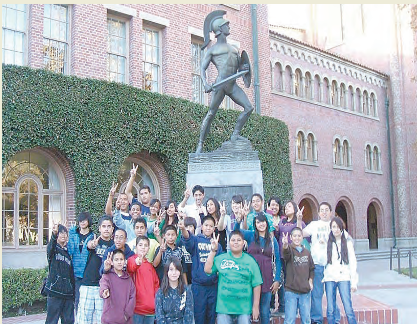
Students from Southwest Middle pose with "Tommy Trojan" on the USC campus during one of the annual university tours. Incentive trips to visit college campuses are one way Southwest works to create a college-going culture.